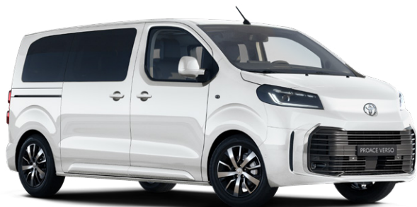
EPR Bílá ledová standardní lak bez příplatku