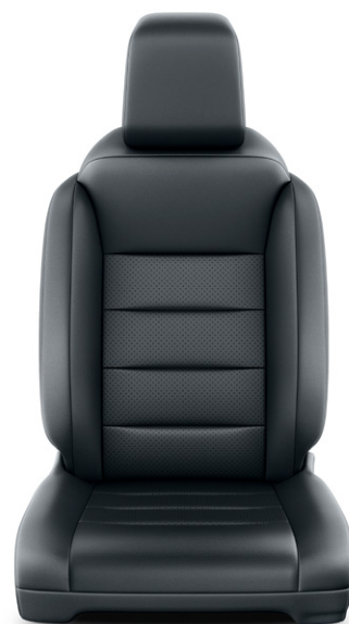
Čalounění sedadel černé kožené Pro výbavu VIP, paket Executive