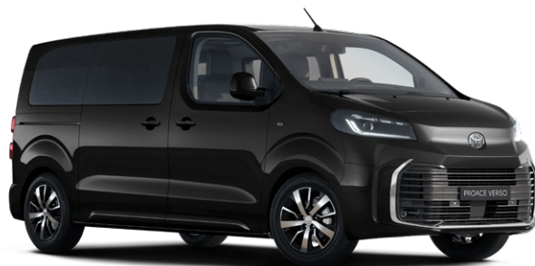
KTV Černá Sicílie metalický lak 15000 Kč