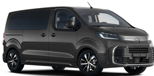
KKJ Šedá titanová metalický lak 15000 Kč