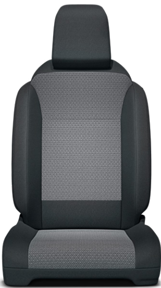
Čalounění sedadel Toyota v kombinaci černé a šedé barvy – textilie Pro výbavu Family