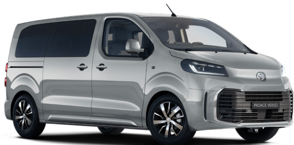
KCA Stříbrná atomická metalický lak 15000 Kč