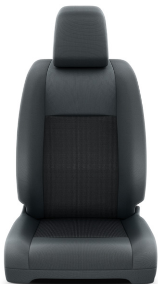
Čalounění sedadel tmavě šedé – textilie Pro výbavu Kombi a Business