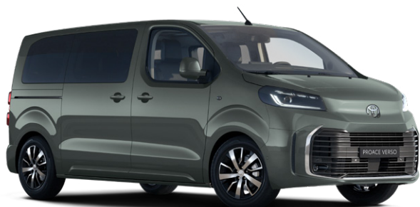
EDU Zelená terénní metalický lak 15000 Kč