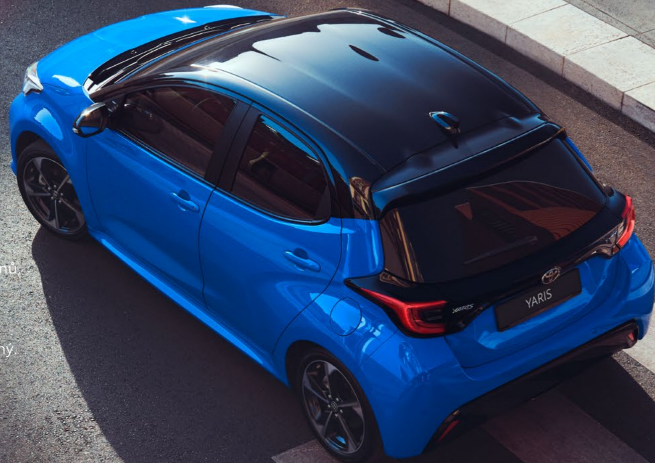
Varianty dvoubarevného lakování Toyota Yaris

Vyberte si z podmanivé nabídky atraktivních odstínů zahrnující výrazné pastelové barvy i zářivé metalické laky. Váš Yaris ve zcela novém odstínu „Modrá Neptune“ nebo dvoubarevném lakování „Modrá Juniper“ bude jednoduše nepřehlédnutelný.