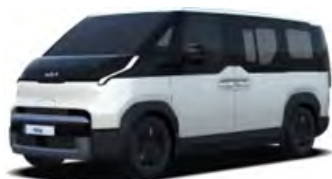
Bílá Clear (UD) bez příplatku