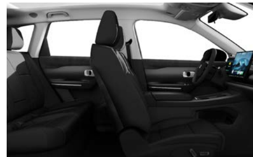
Černý interiér Midnight Aurora (doprodej skladových zásob)