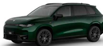
Zelená GLAZED (0YF)