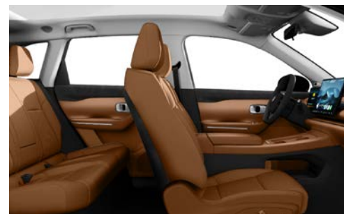
Interiér Hnědá Camel Hnědá Criollo (doprodej skladových zásob)