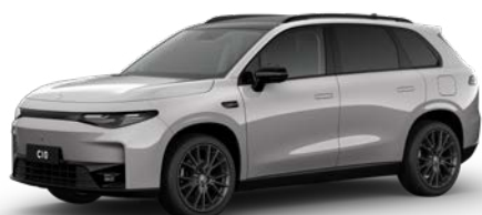
Šedá TUNDRA (0GD)