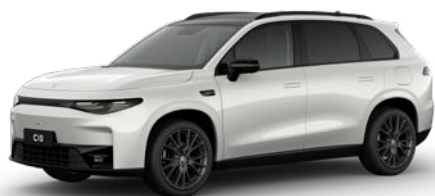
Bílá PEARLY (0AH)

Uvedené doporučené ceny se vztahují na vozy objednané od 7. 1. 2026 do 31. 3. 2026. Limitovaná nabídka na skladové vozy platí do vyprodání zásob.