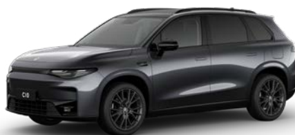
Šedá CANOPY (0GM)