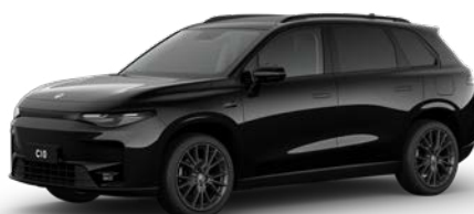
Černá METALLIC (0KL)