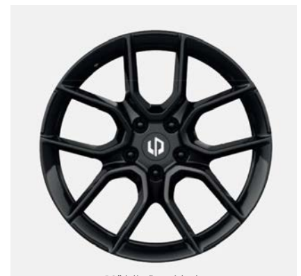
18" hliníková kola