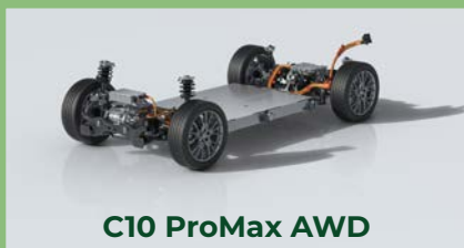
C10 ProMax AWD