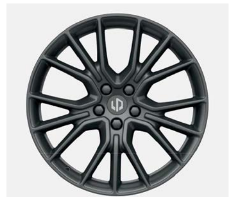
20" hliníková kola